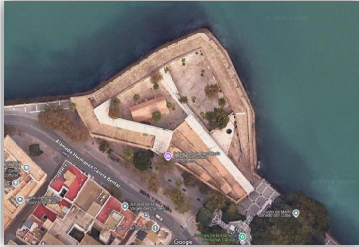
Baluarte de la Candelaria