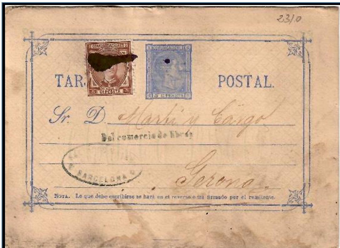
Tarjeta entero postal de Barcelona a Gerona fechada el 23 de septiembre de 1876, Franqueo de 5 cts. para tarifa nacional para cualquier peso, con matasello de pincel. El timbre fiscal correspondiente al impuesto de guerra (5 cts.) fue sustituido por uno postal, lo que implica un uso indebido ya que este "recargo transitorio de timbre" debía hacerse con sellos "que se distinguirían con la inscripción Impuesto de guerra..." (art. 3 del Decreto de 2 de octubre de 1873).