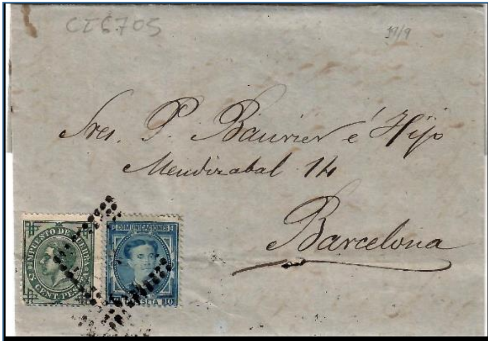
Carta de Haro a Barcelona fechada el 19 de septiembre de 1876, Franqueo de 10 cts. para tarifa nacional de hasta 15 gr. y 5 cts. de impuesto de guerra, con matasello rombo de puntos. Uso del rombo de puntos una vez dictada la circular del inicio de uso del matasello encarnado de pincel.

Y es entre el 19 y el 21 de septiembre cuando se documenta la llegada progresiva de los pinceles y la tinta encarnada en algunas poblaciones, mientras que en otras aún se siguió matasellando con el rombo de puntos, confirmando de este modo la diversidad temporal en su aplicación inicial.