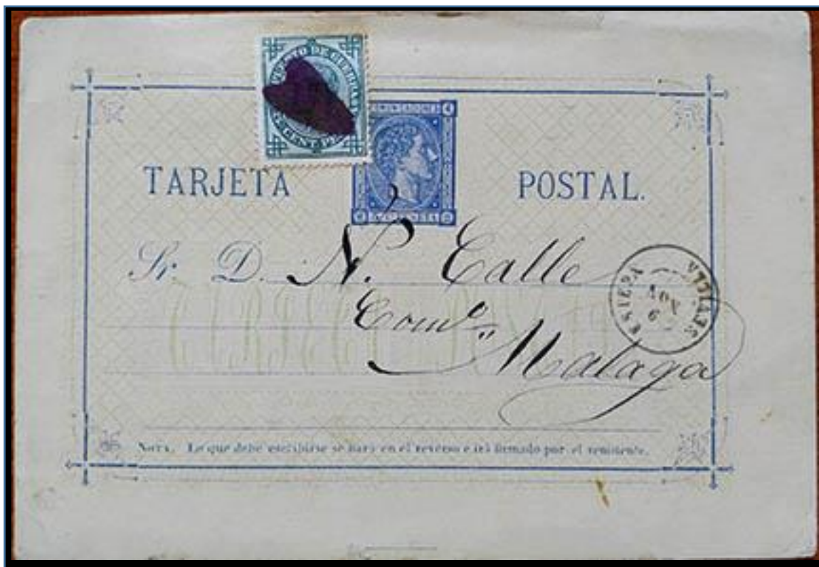
Tarjeta entero postal de Estepa (Sevilla) a Málaga matasellada el 9 de noviembre de 1876, Franqueo impreso de 5 cts. para tarifa nacional de cualquier peso y 5 cts. de impuesto de guerra, con matasello de pincel.