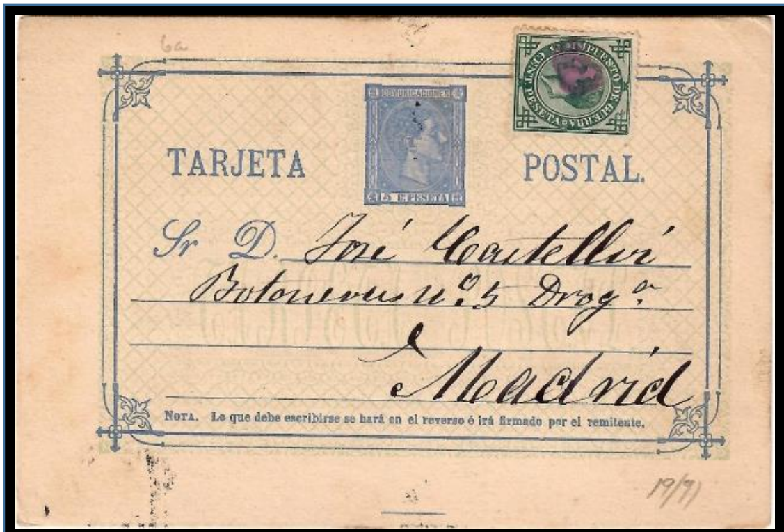
Tarjeta entero postal de Toledo a Madrid fechada el 19 de septiembre de 1876, Franqueo impreso de 5 cts. para tarifa nacional de cualquier peso y 5 cts. de impuesto de guerra, con matasello de pincel.