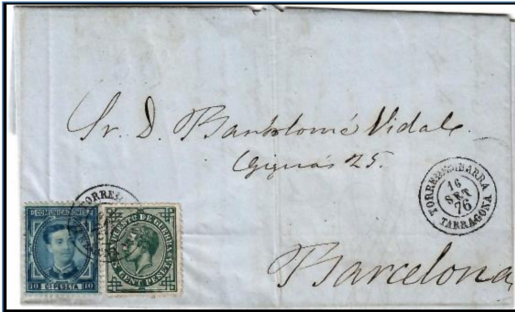
Carta de Torredembarra matasellada el 16 de septiembre de 1876. Franqueo de 10 cts. para tarifa nacional de hasta 15 gr. y 5 cts. de impuesto de guerra, con matasello fechador negro tipo 1857. Uso del fechador como matasello una vez dictada la circular del inicio de uso del matasello encarnado de pincel.

La Circular del 8 de septiembre de 1876 determinada que "... con la tinta que en breve se remitirá á V ... para que en el momento que la reciba se proceda a su uso...". Ello implica que no existe propiamente un primer día de esta modalidad de matasello, ya que en el momento de dictar la Circular la tinta y los pinceles no habían sido distribuidos por las diferentes oficinas, por lo que su implantación estaba condicionada, en primer instancia, a su recepción. En todas las poblaciones, a excepción de Madrid, hemos documentado exclusivamente el uso del matasello rombo de puntos (e incluso del fechador tipo 1857) hasta el día 17 de septiembre.