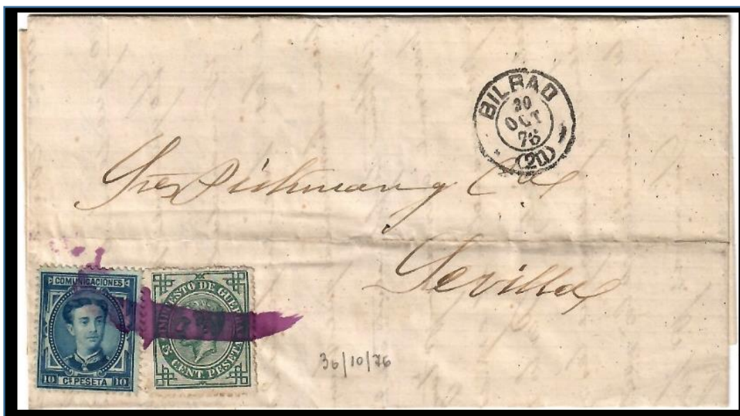
Carta de Bilbao a Sevilla matasellada el 30 de octubre de 1876, Franqueo de 10 cts. para tarifa nacional de hasta 15 gr. y 5 cts. de impuesto de guerra, con matasello de pincel y fechador negro tipo 1871. Carta correspondiente al día en que se dictó la Circular para dejar de usarse el matasello de pincel y la tinta encarnada. .

Su uso tuvo escasa vigencia (53 días desde que se dictó la Circular de implantación), ya que el 30 de octubre de 1876 el Director General de Correos y Telégrafos dictó una Circular disponiendo vuelvan a inutilizarse los sellos de franqueo con el de fechas de cada oficina , debido al mal uso dado a la tinta (que se disolvía en exceso).