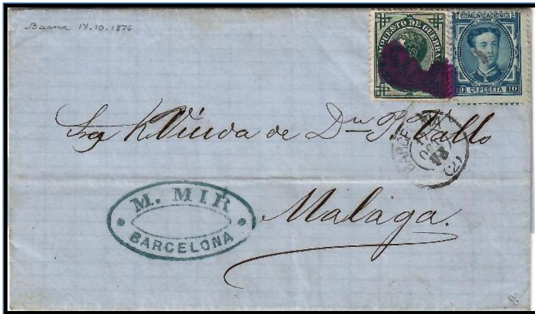
Carta de Barcelona a Málaga matasellada el 17 de octubre de 1876. Franqueo de 10 cts. para tarifa nacional de hasta 15 gr. y 5 cts. para impuesto de guerra, con matasello de pincel y fechador negro tipo 1871.