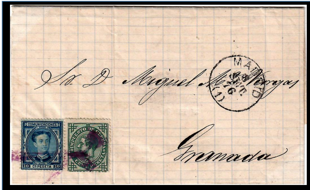
Carta de Madrid a Granada matasellada el 8 de septiembre de 1876. Franqueo de 10 cts. para tarifa nacional de hasta 15 gr. y 5 cts. para impuesto de guerra, con matasello de pincel y fechador negro tipo 1876. Primer día de implantación del matasello encarnado de pincel.

La Circular del 8 de septiembre de 1876 concreta que la tinta debía ser de color encarnado y aplicada con brochita o pincel, arrastrándola sobre el sello para matasellarlo muy ligeramente. Y determina que tanto la tinta como el pincel/brocha se remitirían a las oficinas principales y subalternas.