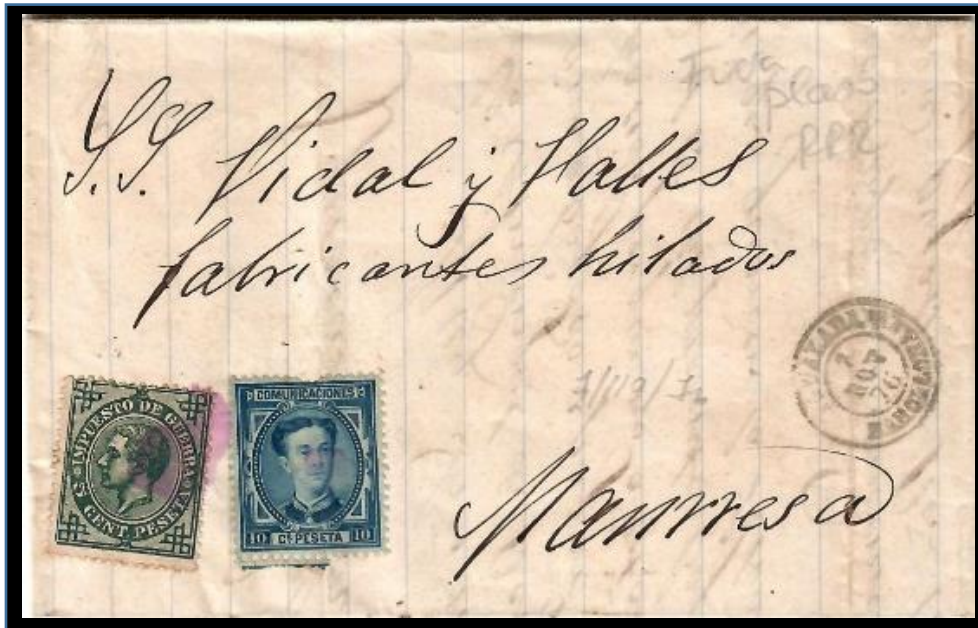
Carta de Igualada a Manresa matasellada el 7 de noviembre de 1876. Franqueo de 10 cts. para tarifa nacional de hasta 15 gr. y 5 cts. para impuesto de guerra, con matasello de pincel y fechador negro tipo 1857. Uso del matasello de pincel una vez dictada la circular para supresión.

Al igual que con el inicio de la regulación del matasello encarnado de pincel, tampoco hay una fecha límite en la finalización de este singular matasello. La Circular del 30 de octubre de 1876 indicaba a las oficinas que “desde el momento en que reciba la presente circular ordena la supresión y abandono ... del líquido encarnado y pinceles actualmente en uso...”. Ello implicó que durante los primeros días de noviembre se siguiera utilizando el matasello objeto de estudio.