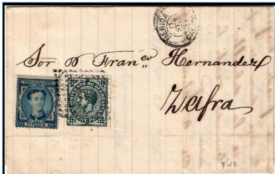
Carta de Lérida matasellada el 17 de septiembre de 1876. Franqueo de 10 cts. para tarifa nacional de hasta 15 gr. y 5 cts. de impuesto de guerra, con matasello rombo de puntos y fechador negro tipo 1871. Uso del rombo de puntos como matasello una vez dictada la circular del inicio de uso del matasello encarnado de pincel.